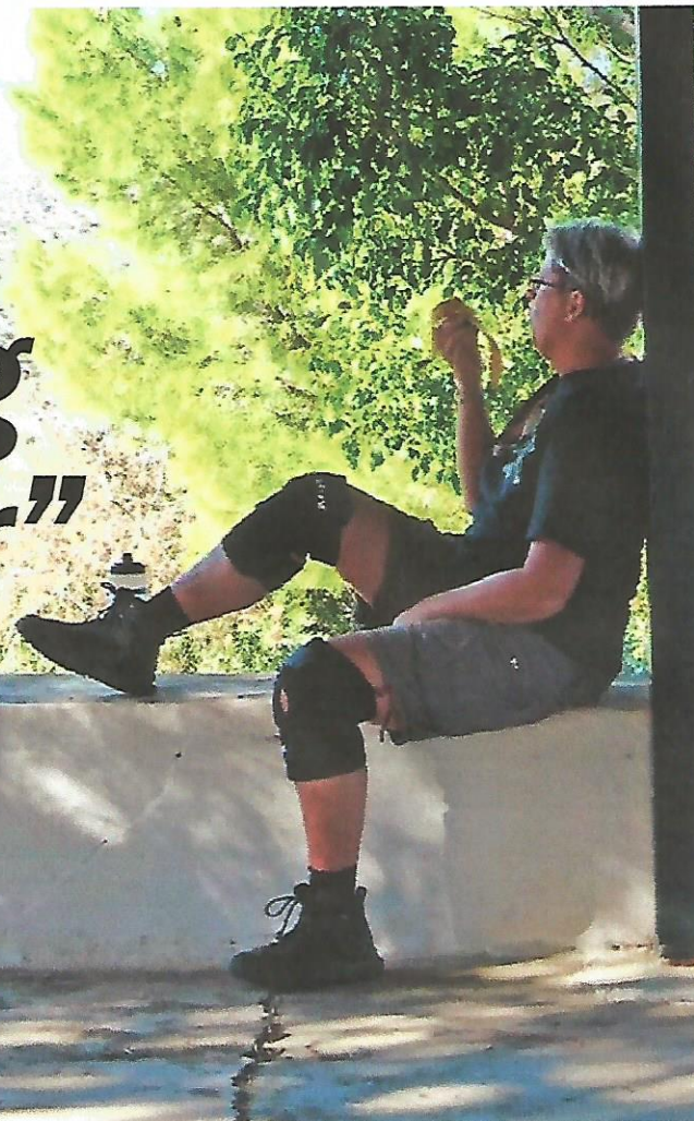
Det kan bli ett par Sverigebesök om året, men Ia ser Kreta som sitt hem nu.

M an räknar med att cirka 2500 svenskar bor i Grekland – många av dem på Kreta som länge varit ett av svenskarnas favoritresmål. Det är inte konstigt. Med ett snitt på 300 soldagar per år är det perfekt för värmestörstande svenskar.